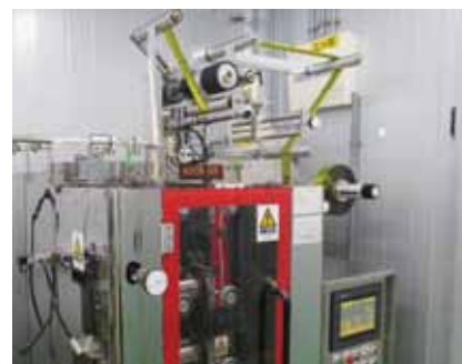
スティックに充填