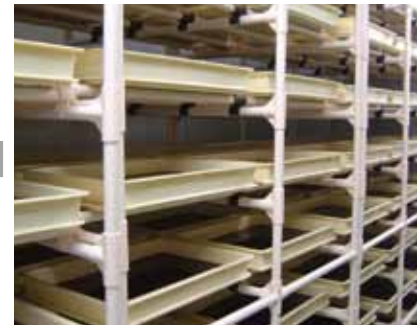
自然乾燥による濃縮工程