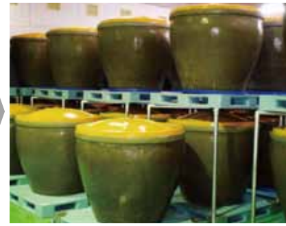
陶器製かめでの熟成