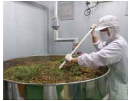
原材料を攪拌(エキス抽出)